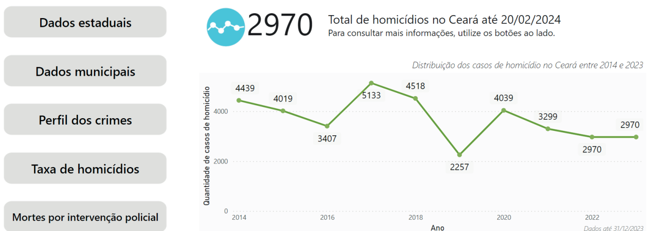
Figura 1. Painel de Monitoramento de Homicídios - Acesse em www.cadauidaimporta.com.br .

Em Fortaleza, por exemplo, os números não permaneceram os mesmos. Em 2022,